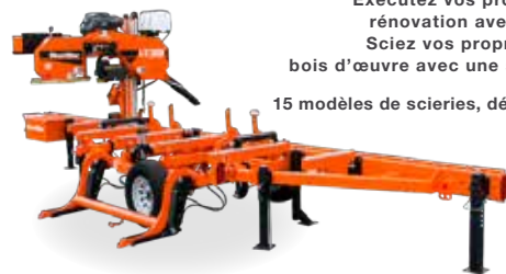
LT35HDG25 illustré avec l'écorceuse en option.

15 modèles de scieries, débutant avec le modèle LX25, à partir de 4 885$*.